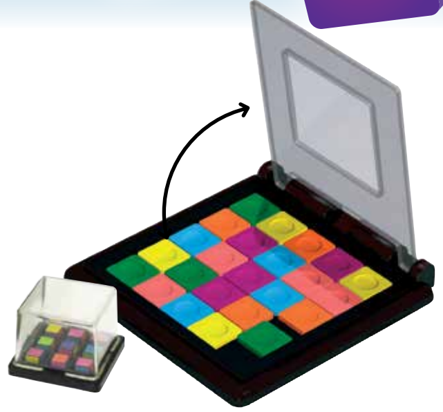
Düzenek Kapağı ve Desenin Çerçeve Görünüşü